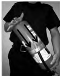
Faites bouger l'agent extincteur (poudre) en tapant le fond de l'extincteur