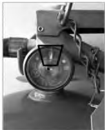
Assurez-vous d'une pression adéquate sur le manomètre