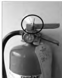
Vérifiez le bon positionnement de la goupille